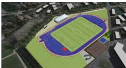
Rénovation de la piste d'athlétisme du stade Pagnetti pour 1.2 millions d'€