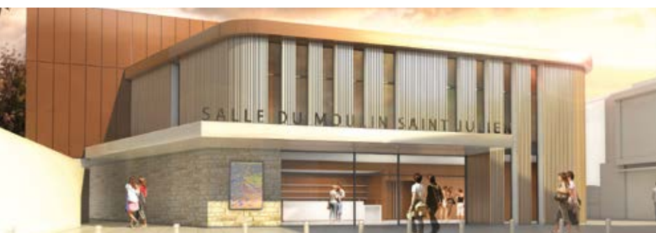
Création d'une salle polyvalente de 300 places assises pour 3.2 millions d'€