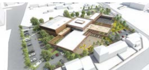
Un nouveau Centre de loisirs et gymnase pour 7.845 millions d'€ au total

Avec 18 000 000 € dépensés cette année, jamais la Ville de Cavaillon n'a autant investi pour accroître son offre de services et d'infrastructures. Focus sur quelques projets.